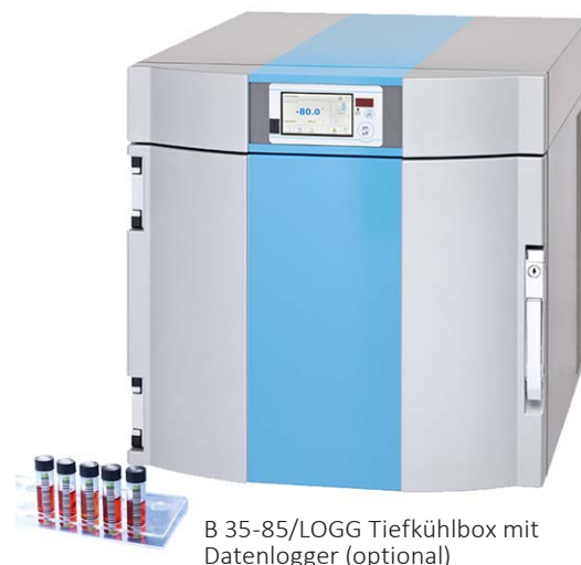
B 35-85/LOGG Tiefkühlbox mit Datenlogger (optional)