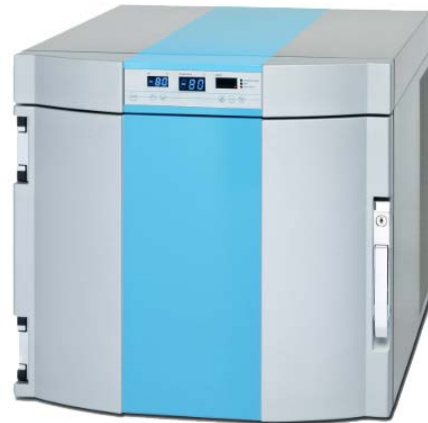
B 35-85 Tiefkühlbox (ohne Datenlogger) Artikelnummer: 104.5104