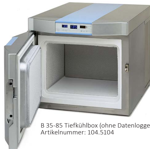
B 35-85 Tiefkühlbox (ohne Datenlogger) Artikelnummer: 104.5104