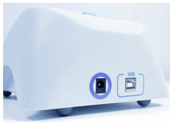
Photometer DEN-600, Rückseite