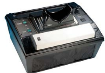
C-65 mit 8 Watt Lampe