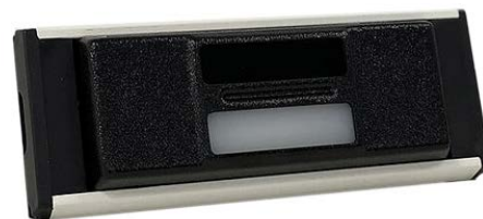
4 Watt Lampe mit Weißlicht