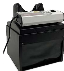
C-10E4 mit 4 Watt Lampe