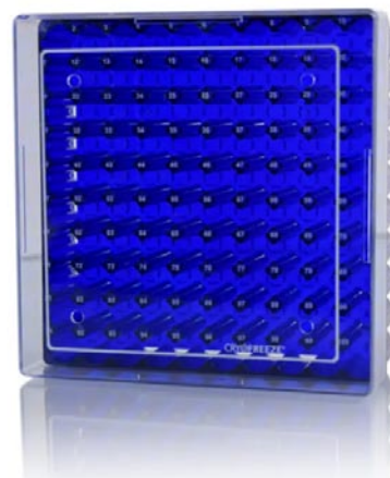
Cryovial-Box blau mit 100 Plätzen, für 1.2 – 2 ml Tubes