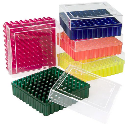
Cryovial-Box mit 100 Plätzen

Der Gitterindex, der sich auf dem Rack selbst und nicht auf dem Deckel befindet, ermöglicht eine schnelle und effiziente Probenlokalisierung ohne die Verwirrung der Deckelplatzierung. Um Druckunterschiede zu vermeiden, verfügen die Boxen über Belüftungsöffnungen im Boden und Deckel.