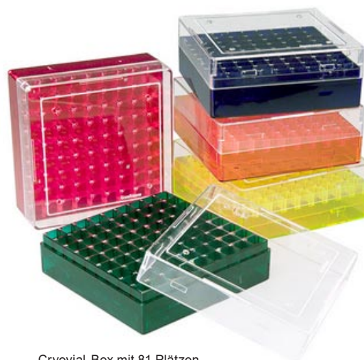
Cryovial-Box mit 81 Plätzen

Der Gitterindex, der sich auf dem Rack selbst und nicht auf dem Deckel befindet, ermöglicht eine schnelle und effiziente Probenlokalisierung ohne Verwirrung durch die Deckelplatzierung. Zur Vermeidung von Druckdifferenzen verfügen die Boxen über Lüftungsöffnungen in Boden und Deckel.