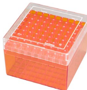
Cryovial-Box orange mit 81 Plätzen, für 3-5 ml Tubes