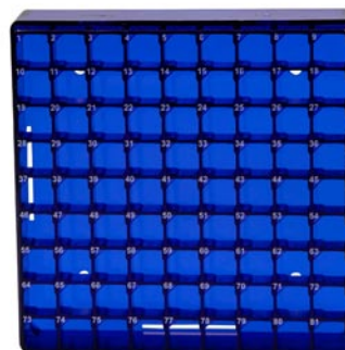
Cryovial-Box mit 81 Plätzen