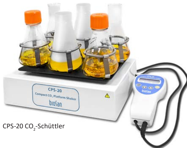
CPS-20 CO 2 -Schüttler

Die Fernbedienung sorgt für eine störungsfreie Inkubatorumgebung während des laufenden Experiments. Die Fernbedienung ist für den Betrieb in Kühlräumen, Inkubatoren und geschlossenen Laborräumen bei einer Umgebungstemperatur von +4°C bis +40°C in nicht kondensierender Atmosphäre und einer relativen Luftfeuchtigkeit bis zu 80% ausgelegt.