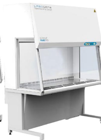
Mars Pro 1800 (650 x 1800 x 700)