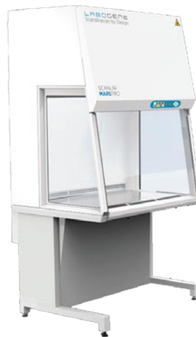
Mars Pro 900 (650 x 900 x 700)