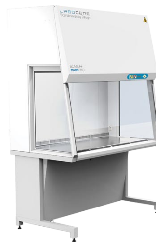
Mars Pro 1200 (650 x 1200 x 700)