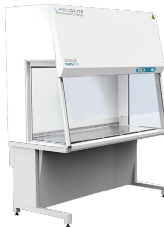
Mars Pro 1500 (650 x 1500 x 700)