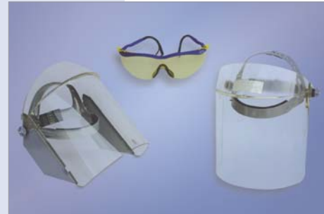
Gesichtsschutz und Brille

Auf Wunsch liefern wir auch Sonderanfertigungen für größere Lampentypen.