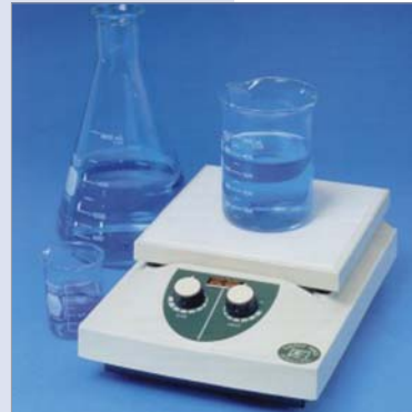
EchoTherm HS 10 Series